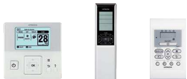
sterownik przewodowy standardowy z programatorem tygodniowym